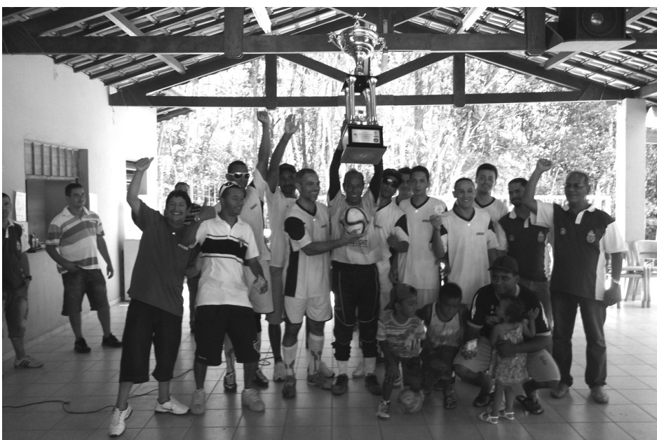
CAMPEÃ: Jogadores da Komatsu levantam o troféu de campeões, com alegria e muita festa

A novidade deste ano foi a entrega de plaquetas, ao invés de medalhas. A premiação ocorreu em clima de muita amizade e descontração no Sítio.