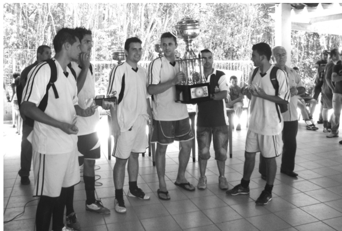
3º LUGAR: Difil 'A' venceu a EDDF por 8 a 5 e levou troféu para casa