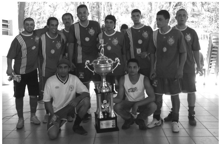
VICE: Acústica Dan também fez bonito no torneio e faturou troféu